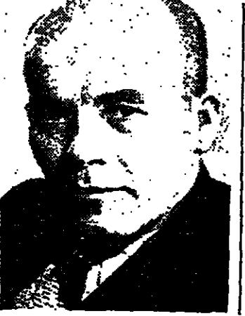
تفسير جديد في تشيكوسلوفاكيا

وارسو - رويتر - اعلن الجيش البولندي ولاءه للمستر فلاديسلاف غومولكا زعيم الحزب الشيوعي في فترة مناورات سياسية مستمرة اعتبست اضطرابات طلابية واشتباكات في الشوارع في مختلف انحاء بولندا . وقد انتهت الصحف البولندية الستالينية القمامة ويهودا يؤيدون اسرائيل والرجعيين والذئاب الاستعمار بالتحريش على الاضطرابات واستغلال هذه الاضطرابات في محاولة لتقويض سلطة المستر غومولكا ويأتي تاييد الجيش للمستر غومولكا في أعقاب تمديدالولاء للرئيس البولندي اعلنه المستر ادوارد جيريك زعيم الحزب في سيليزيا وتمهد مجاله لانتعاش منظمة المحاربين القدامى التي يتزعمها الجنرال مايستريزتس موكرار وزير الداخلية .